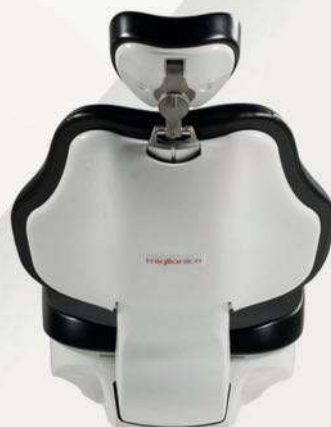
XL MÉMOIRE DE FORME